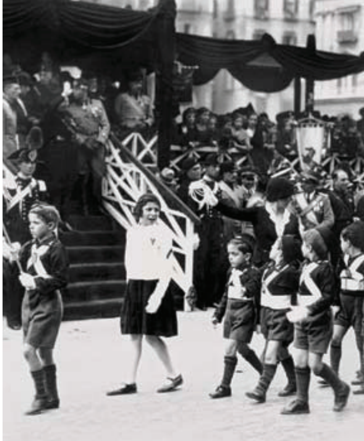
Balilla-drenge til parade, anført af en pige! Alle fascistiske mærkedage blev udnyttet til, at ungdomskorpssene blev stillet op til parader, hvor også de kunne vise deres færdigheder.

Men det blev understreget, at de skulle undgå for konkurrenceprægede sportsgrene. Det egentlige formål for piger og unge kvinder var jo at blive sunde og energiske mødre.